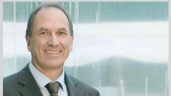
Martin Graf, Alt-Regierungsrat Grüne Kanton Zürich

Martin Graf war als Zürcher Regierungsrat auch Mitglied des Axpo-Verwaltungsrats und wies dort immer wieder auf die prekäre Finanzlage rund um die Stilllegung und Entsorgung unserer AKW hin, wenn diese einmal abgeschaltet werden. In der Diskussion um das Atommülllager taucht die ungesicherte Finanzierung immer wieder auf. Aber auch beim Streit um die Laufzeit der Schweizer AKWs spielt Geld eine grosse Rolle. Martin Graf engagiert sich in der politischen Debatte um die Kostenwahrheit bei der Atomenergie und dem schwierigen Erbe, welches der Atomstrom uns hinterlässt. Kürzlich hat er das Thema bei der Präsentation der „Benkener Thesen“ eindrücklich geschildert, verbunden mit konkreten Forderungen. Erfahren Sie mehr dazu direkt von unserem Referenten.